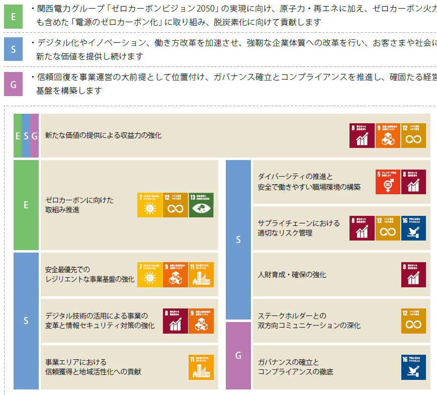
表-1 関西電力グループのマテリアリティ(重要課題)

2021年3月、関西電力グループは、新たな経営理念のもと変化する事業環境に対応し、持続的成長を遂げるため、5カ年の実行計画として、「関西電力グループ中期経営計画(2021-2025)」を策定しました。この中で、関西電力グループは、地球温暖化問題・CO 2 削減への対応として、ゼロカーボン発電電力量国内 No.1 及び国内発電事業に伴う CO 2 排出量を 2025 年度に半減(2013 年度比)という具体的な実現目標を掲げています。また、中期経営計画の策定に合わせ、SDGs 等のグローバルな社会課題の解決を通じた持続可能な社会の実現へ貢献するため、ESG 上の重要課題として下記 10 個のマテリアリティ(重要課題)の特定を実施し取組みを推進しています(表-1)。