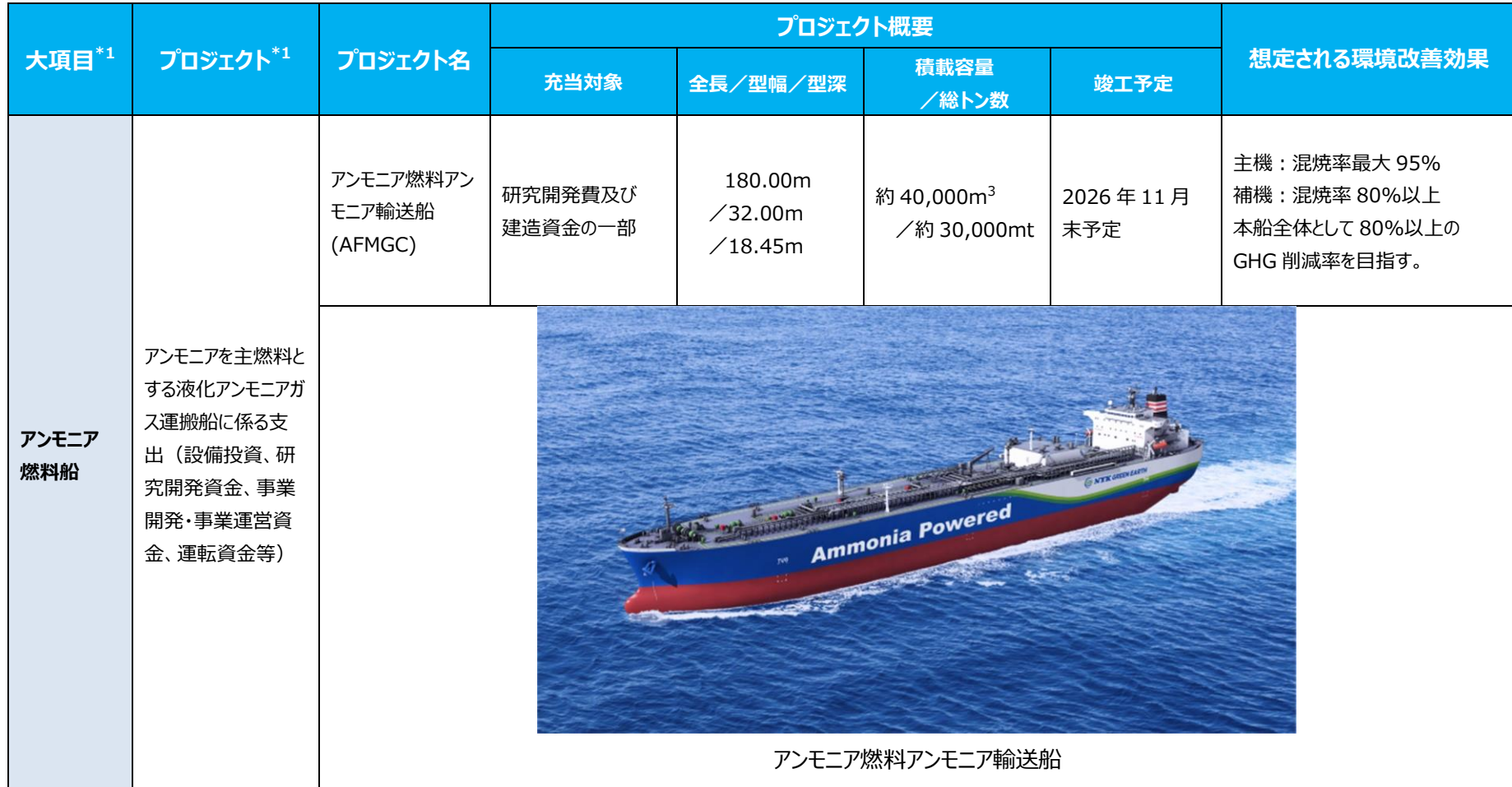
アンモニア燃料アンモニア輸送船