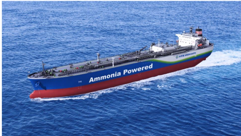
図-3 アンモニア燃料アンモニア輸送船(イメージ)